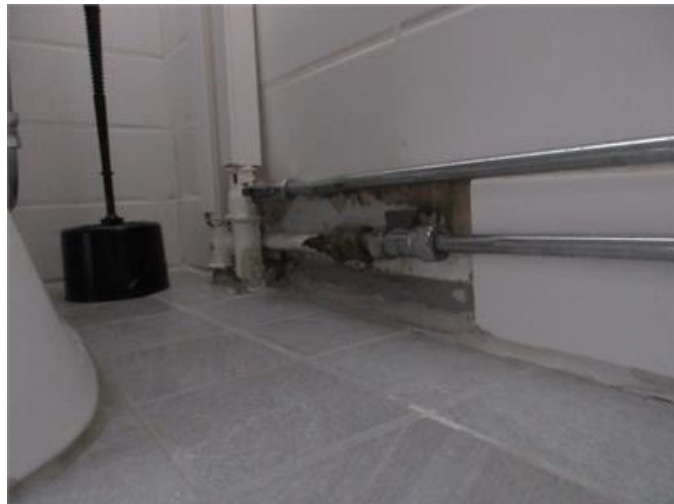
Okaklad vägg i toalett