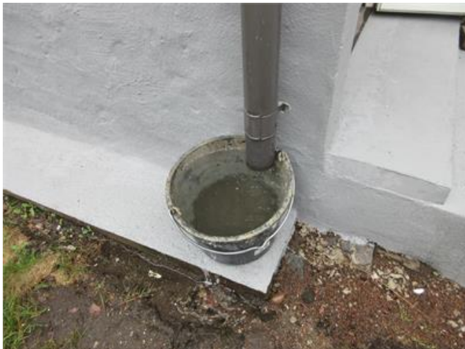
Regnvatten släpps på marken intill hus